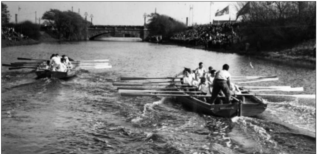
Op het Verversingskanaal ter hoogte van Houtrust werden in de jaren vijftig op Koninginnedag altijd sloepenraces gehouden. De deelnemende teams kwamen van de acht zeevaartscholen die Nederland toen nog telde. Op deze foto uit het Gemeentearchief wordt de finale gevaren tussen de teams van Scheveningen en Rotterdam. De Rotterdammers lagen hier - roeiend in de richting van de oude Houtrustbrug - al op voorsprong en zouden ook winnen.

Enkele andere wijken langs het kanaal hebben inmiddels al een discussieavond achter de rug.